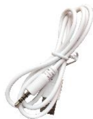
USB nabíjací kábel