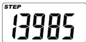
Zobrazenie počtu krokov

Displej zobrazuje počet krokov a prejdenu vzdialenosť.