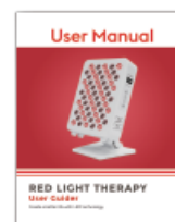
Návod – 1 ks