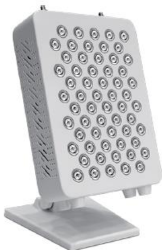
LED panel – 1 ks