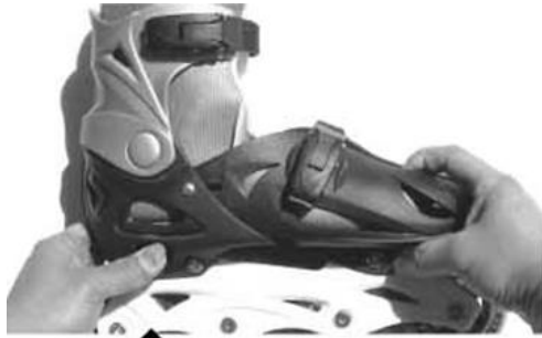
Potiahnutie špičky (stlačením tlačidla)