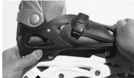
Potlačenie špičky (stlačením tlačidla)